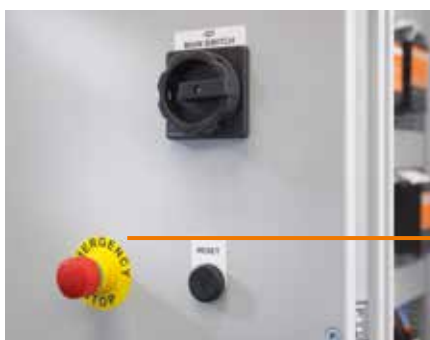
SM/CC: Маркировка на клейкой основе – уверенность в том, что устройства будут использоваться правильно