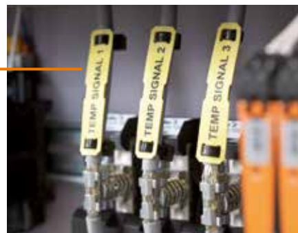
SFX: Кабельная маркировка с фиксацией стяжками