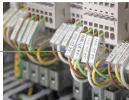
TM-I: провод легко вставляется в маркировочную муфту до или после монтажа