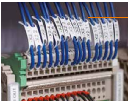
WM: Маркировка для проводов монтируется без инструментов – отформатировать план-проект на компьютере и пустить рулон на печать