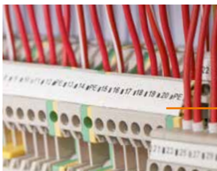
DEK/WS: Маркировка для клемм – напечатал, установил – готово