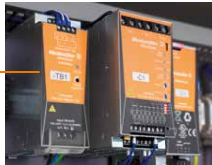
ESG: Идентификация любого оборудования - простая маркировка для быстрого распознавания компонентов